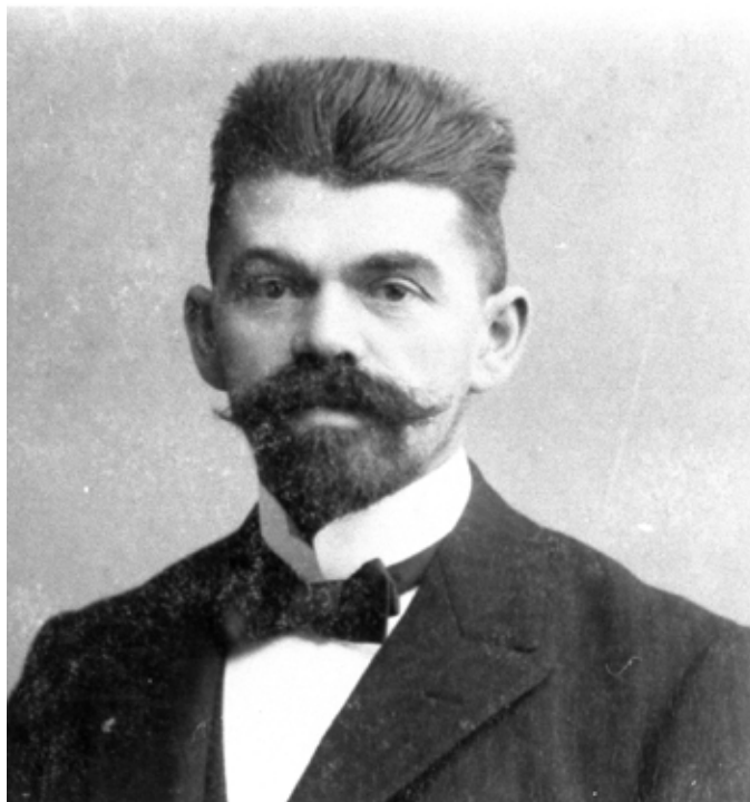
Ved skolebørnenes konfirmationer sendte Grosbøll dem et lykønskingskort med sit fotografi på.

Som 16 årig skulle Grosbøll være rejst til USA til tre halvbrødre dér, og han blev vist i USA i fire år.