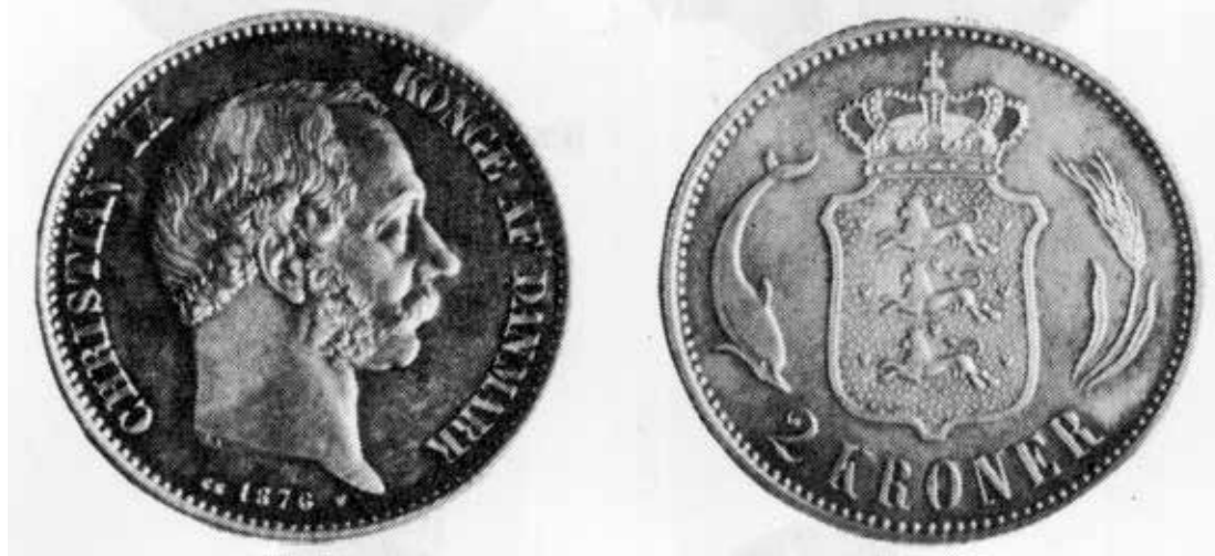
Og den nye sølvtokrone med Chr. d. 9.s billede – samme sølvindhold som rigsdaleren.

Det gamle system var, at en rigsdaler deltes i 96 skilling, men man havde en møntværdi imellem – 1 mark, som var 16 skilling. Altså gik der 6 mark på en rigsdaler.