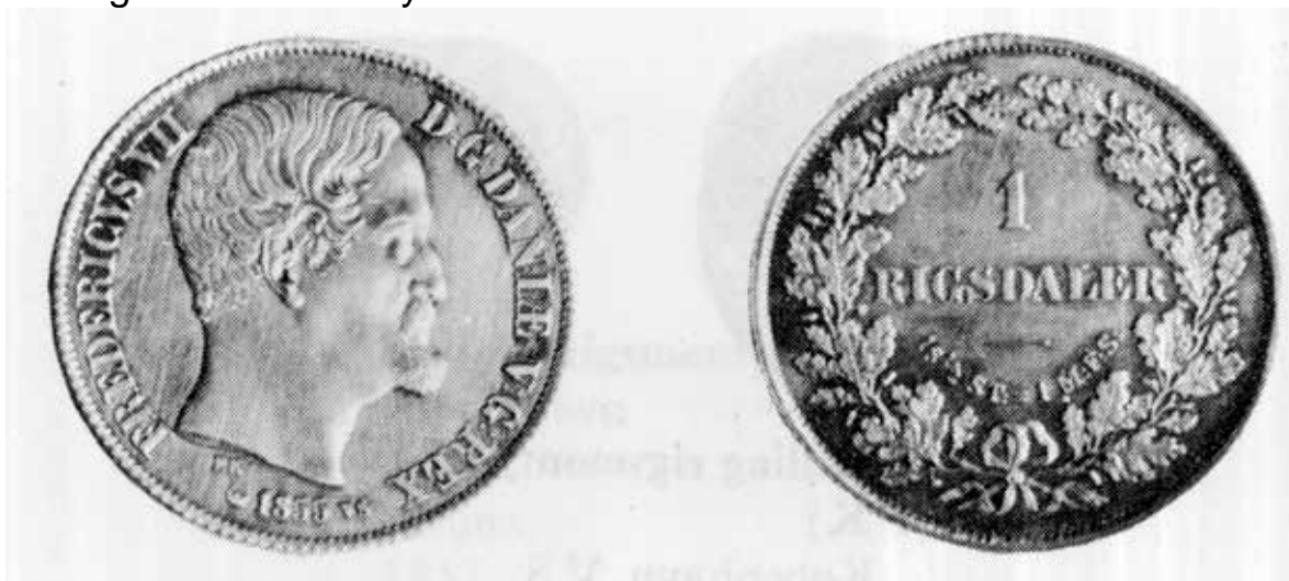
Den sidste rigsdalermønt fra Frederik den 7.s tid – sølv. Her i dobbelt størrelse.

Det hænger nok sammen med, at sølvværdien af den hidtidige rigsdalermønt svarede ganske til den nye tokrone.