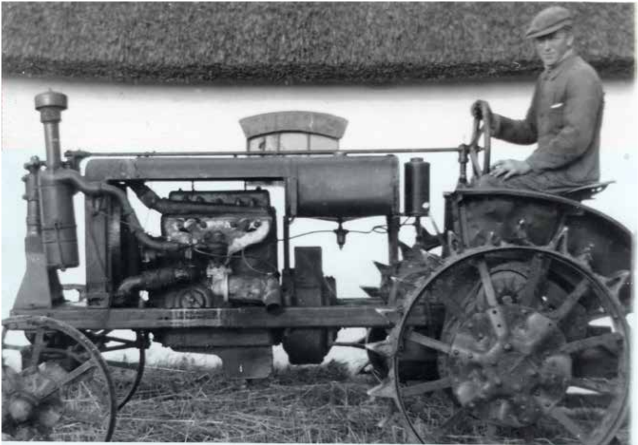
Svend Jørgensen på sin gamle russisk fremstillede traktor med jernhjul for og bag.