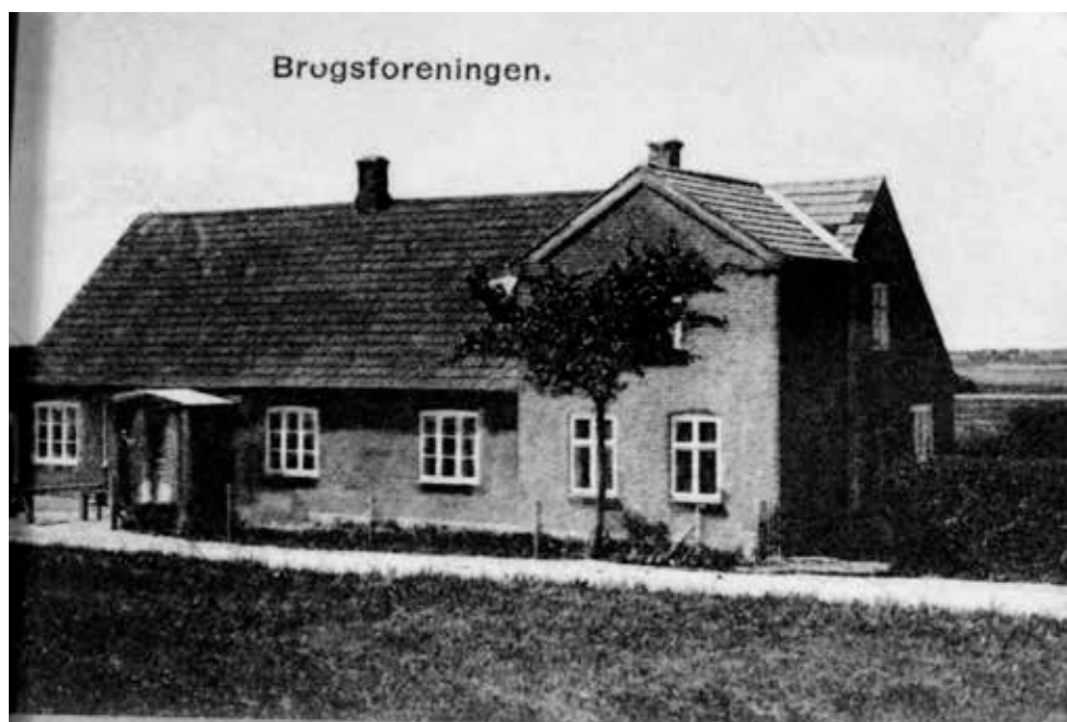
Foto: Harløse Brugsforening på Harløsevej i Ny Harløse, ukendt årstal. Brugsen blev først flyttet til dette sted, da Hillerød-Frederiksværkbanen var bygget i 1897. Jernbanen var dengang eneste alternativ til hestevognstranport, så Harløse Station tiltrak det beskedne erhvervsliv, som blev til bebyggelsen Ny Harløse, herunder Brugsen. Bemærk Harløsevejens beskedne bredde. I nutiden har bygningen rummet en antikforretning.

Aftenens generalforsamlings-del plejer at vare godt 20 minutter, bl.a. hører man om, hvad der er sket for arkivet i årets løb og lidt om fremtiden.