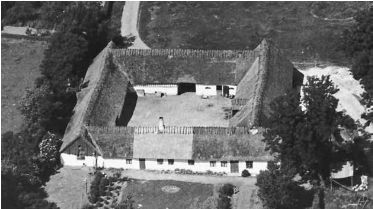
Foto af Holmegård i Tulstrup – nedrevet sidst i 1980erne. På tompten opførtes et kompleks af andelsboliger af en form efter en firelænget bondegård, som Holmegård havde været.