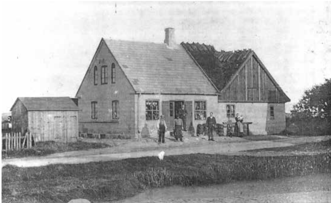
Foto fra før 1898:: Til butik købte Alsønderup Brugsforening i 1883 denne bygning skråt over for Alsønderup Gadekær, som ses i forgrunden.. Denne brugsbygning brændte i august 1908, og en ny bygning opførtes samme år på samme sted. Det er brugsbygningen fra 1908, som langs gaden i Alsønderup indgår i den nuværende købmandsbygning. Til generalforsamlingen viser vi også fotos af andre stadier i brugsbygningens historie.