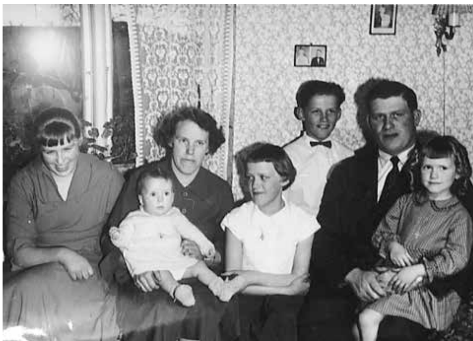
Tekst: Ole Blåkilde. Fotomontage: Lissi Carlsen.