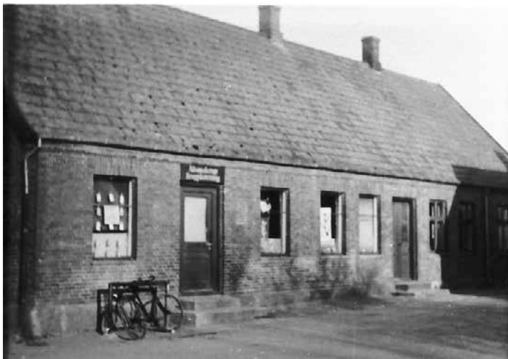
Foto af Alsønderup Brugsforening, som den så ud også op i 1550ern..