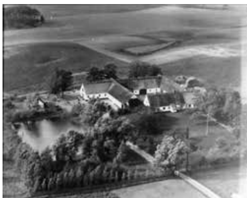
Lykkesholm i Nejde