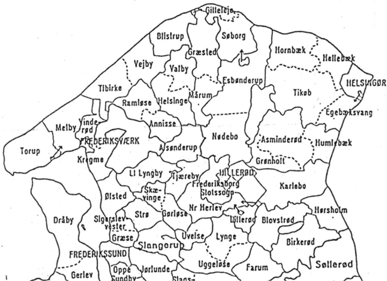
Kort over sognekommuner og kirkesogne i Nordsjælland før sammenlægningerne af kommuner, lidt i 1966 og 1968, og totalt i 1970. Fuldt optrukne linier er grænser mellem kommuner, punkterede linier er grænser mellem kirkesogne, hvor der er flere kirkesogne i samme kommune.

Kredsene dækkede landsbyerne i deres sogneområde, TjærebyKreds f.eks. også Harløse og Ullerød. Nr. Herlev Kreds også Freerslev, Helsingekreds også Laugø, Nejlinge, Ammendrup, Højbjerg, Tofte osv., men i hver kreds var der også enkelte forsikringstagere som faktisk boede i en anden kreds.